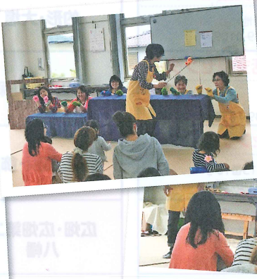
ボランティア手作りの人形と歌おう♪