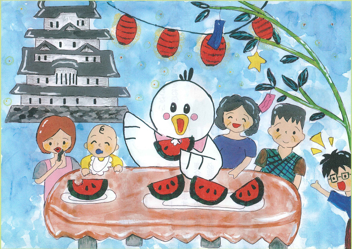
姫路市網干区 Y&Kさんの作品 「姫路城と七夕」

社会福祉法人 姫路市社会福祉協議会 〒670-0955 姫路市安田三丁目1番地 姫路市総合福祉会館内 TEL.079-222-4212 FAX.079-222-4256 URL http://www.himeji-wel.or.jp