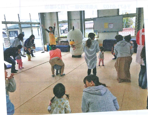
さぎまるくんと一緒にスマイル体操♪