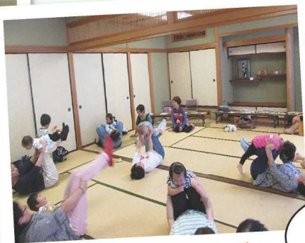
お母さんと一緒にノビノビ〜

さらに、社協野里支部の子育て支援事業として、「子育てサロン」を野里ひろば(旧野里幼稚園)でも実施しています。このように、2か所で開催することによって、少しでも多くの方に参加してもらうよう取り組んでいます。