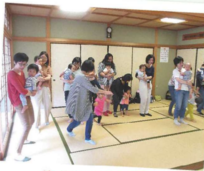
だるまさんがころんだ!!