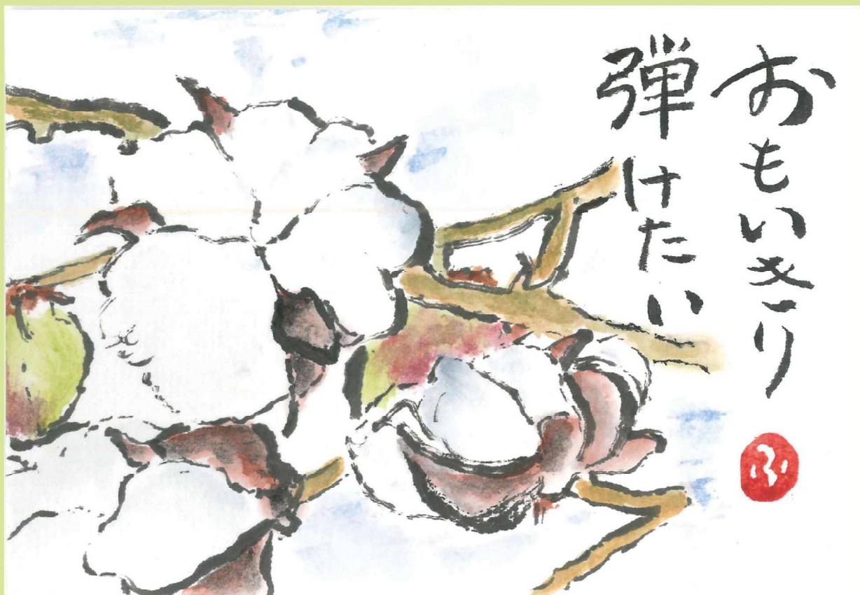
姫路市花田町 嶋尾 房枝さんの作品 「綿の花」

社会福祉法人 姫路市社会福祉協議会 〒670-0955 姫路市安田三丁目1番地 姫路市総合福祉会館内 TEL.079-222-4212 FAX.079-222-4256 URL http://www.himeji-wel.or.jp