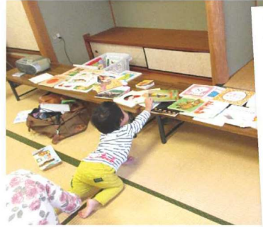
どれにしようかな♪