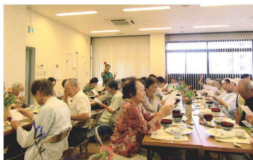
たくさんの方が参加を楽しみにされ、賑やかに食事しています♪