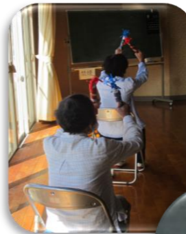
牧野いきいき百歳体操

姫路市では、高齢者の方が「住み慣れた地域でいつまでも元気に暮らす」ことを目指し、地域で「いきいき百歳体操」や「認知症サロン」が開催されています。