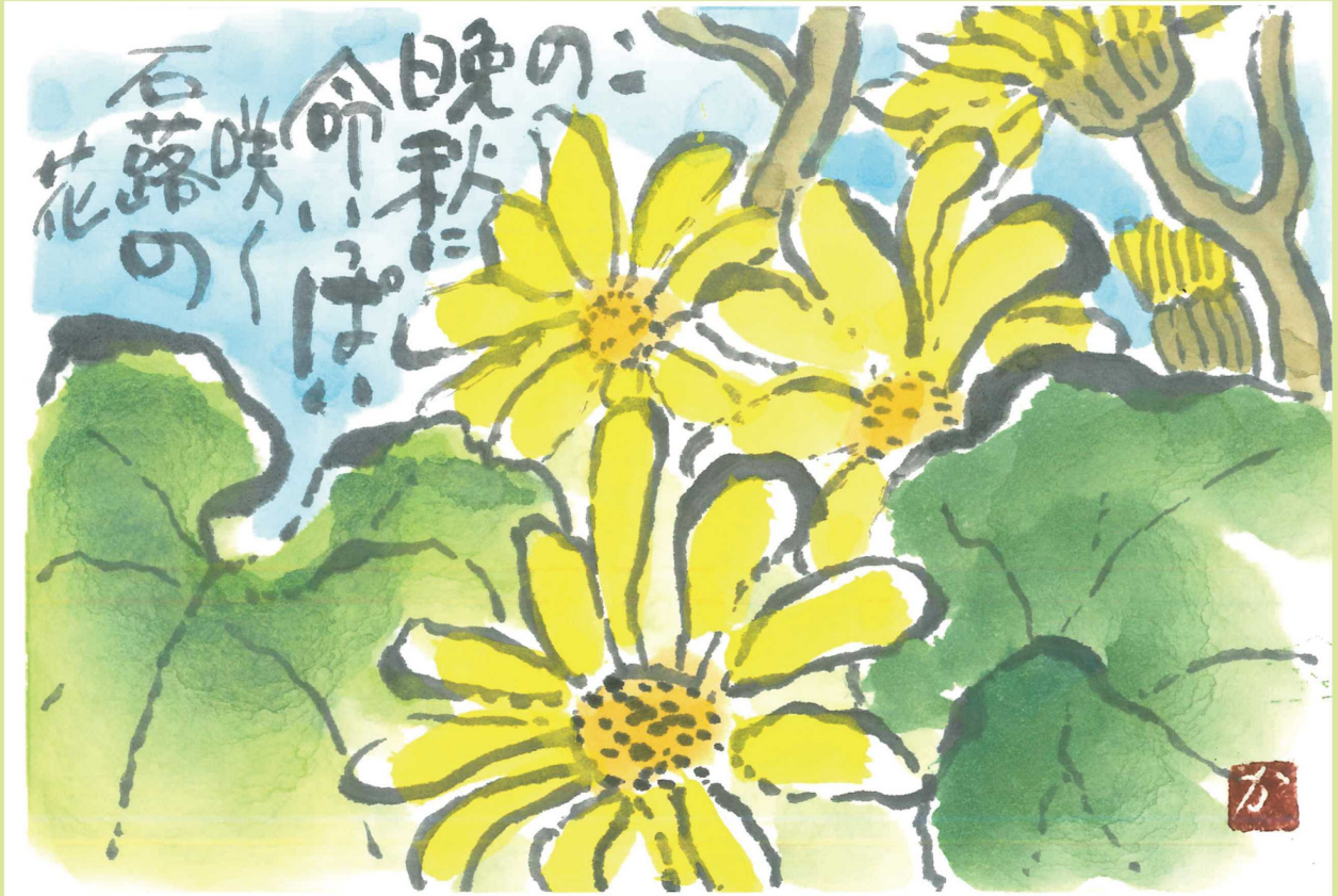
姫路市飾東町庄 長谷川カツヨさんの作品 「青い空と石路の花」

社会福祉法人 姫路市社会福祉協議会 〒670-0955 姫路市安田三丁目1番地 姫路市総合福祉会館内 TEL.079-222-4212 FAX.079-222-4256 URL http://www.himeji-wel.or.jp