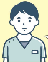
病院の理学療法士

玄関の出入りがしやすいように、手すりを取り付けてほしい。浴室に手すりがあれば私も使いたい。