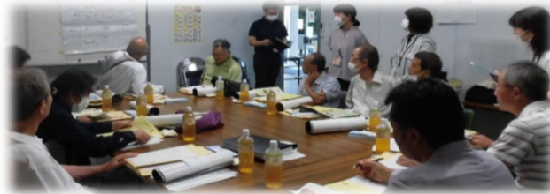
広畑地区 （広畑自治会館）

住み慣れた地域で安心して暮らせる地域づくりや、互いに支え合い、助け合える仕組みづくりを目指して、地域では様々な話し合い（生活支援体制検討会議）が行われています。