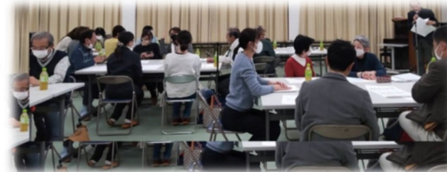
八幡地区 （八幡公民館）

「地域の安全・安心」をテーマに、10年後日頃の暮らしに困るだろうと思うこと、今から少しずつでもできることについて話し合いました。