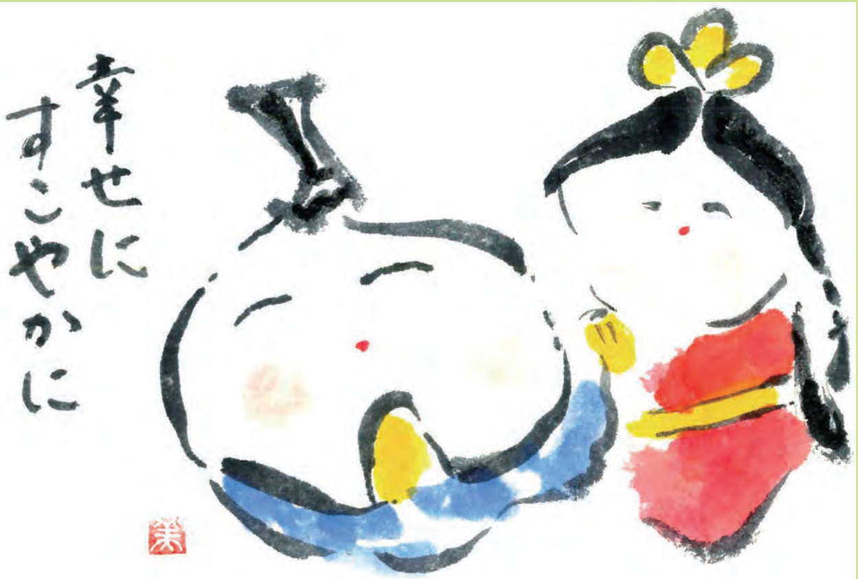
姫路市飾東町 萩原美智子さんの作品 「春を告げる おひなさま」

社会福祉法人 姫路市社会福祉協議会 〒670-0955 姫路市安田三丁目1番地 姫路市総合福祉会館内 TEL.079-222-4212 FAX.079-222-4256 URL https://www.himeji-wel.or.jp